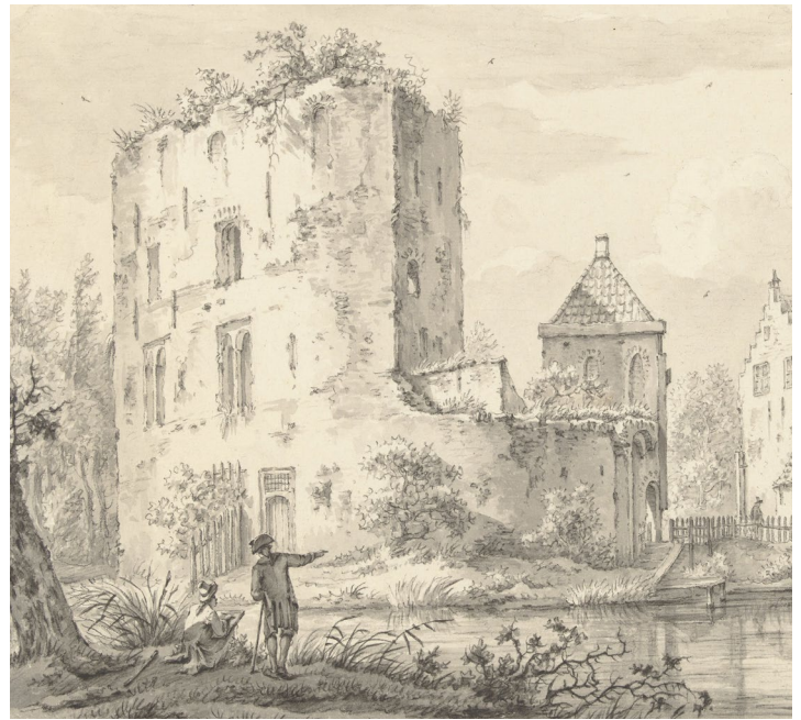
Prent uit ca. 1775 - ca. 1840.

Toen er in 1677 brand uitbrak, werd er niets meer hersteld. De ruïne bestaat tegenwoordig nog uit een ringburcht, met de restanten van de woontoren en het poortgebouw. De restanten werden in 1803 tot monument verklaard en zo'n 80 jaar later geschonken aan het Rijk. Er begon een lange periode van consolidatie, onderzoek en restauratie.