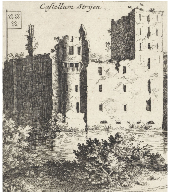
Prent uit 1656

Toch werden er in de 16de-eeuw onderhouds- en herstelwerkzaamheden uitgevoerd. Het kasteel was bewoonbaar, maar had geen vaste bewoner. In 1573 raakte het kasteel door het beleg van de Spanjaarden ernstig beschadigd. Van volledig herstel werd afgezien. Strijen verviel tot ruïne, zoals je op de prent uit 1656 ziet.