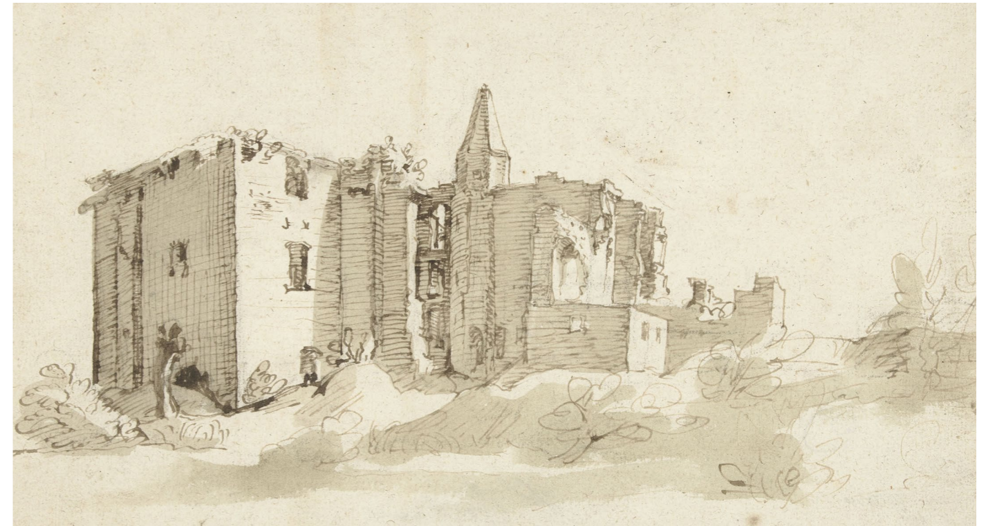
Gravure uit ca. 1600

In 1426 werd kasteel Brederode belegerd door de Haarlemmers. Hierbij werden delen van het complex afgebroken. Het kasteel werd in de jaren daarna hersteld. Na het overlijden van Yolande van Lailang, de weduwe van Reinoud II van Brederode (1415-1473), werd het kasteel niet of nauwelijks meer onderhouden. In 1491 werd het kasteel geplunderd door Duitse soldaten. De genadeklap volgde in 1573, toen het reeds vervallen kasteel door de Spaanse troepen werd geplunderd. Eén deel was nog bewoonbaar, zoals op de prent te zien valt, maar verviel in de eeuwen erna toch tot ruïne. Tegenwoordig resteren nog steeds de kenmerkende elementen van het kasteel.