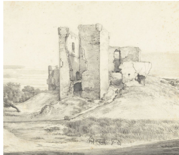
Prent uit 1646-1647

In de twaalfde eeuw verrees op het eiland Oostvoorne een bouwwerk op een omgrachte heuvel: een eenvoudige, verdedigbare woontoren (donjon). Dit type kasteel – het mottekasteel – dankt zijn naam aan de motte of kunstmatige heuvel waarop het gebouwd is. De woontoren reikte tien meter de hoogte in en had muren van bijna drie meter dik.