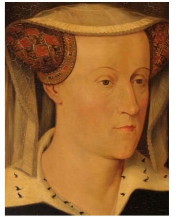
Gravin Jacoba van Beieren

In 1372 kwam de burcht, met het overlijden van Machteld van Voorne, in het gebied van de graaf van Holland te liggen. Echt bewoond werd de burcht niet meer. Wel vertoefde de bekende gravin Jacoba van Beieren (1401-1436), te zien op de schildering, eens in de zoveel tijd op het kasteel. Hieraan dankt de burcht haar bijnaam – de Jacobaburcht.