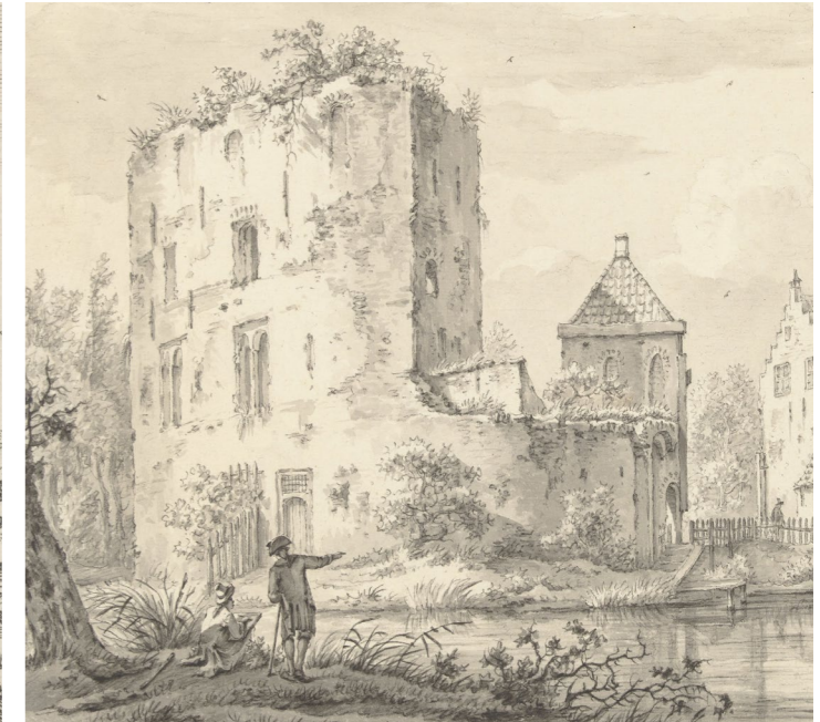
Prent uit ca. 1775 - ca. 1840.

Toen er in 1677 brand uitbrak, werd er niets meer hersteld. De ruïne bestaat tegenwoordig nog uit een ringburcht, met de restanten van de woontoren en het poortgebouw. De restanten werden in 1803 tot monument verklaard en zo'n 80 jaar later geschonken aan het Rijk. Er begon een lange periode van consolidatie, onderzoek en restauratie.