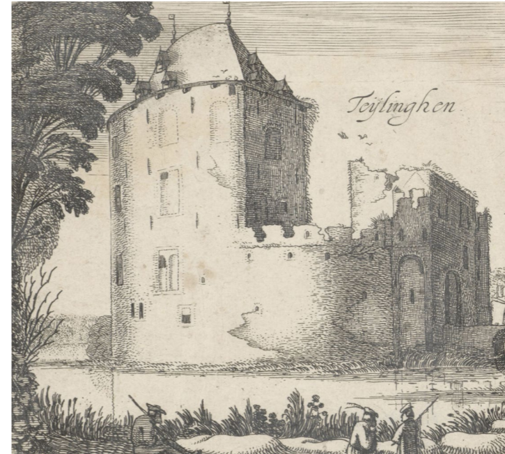
Prent uit 1616

In 1573 werd de donjon gedeeltelijk verwoest, waarna het tot ruïne verviel. Op een afbeelding uit 1596 is de ruïneuze toestand van het gebouw al te zien. Van 1605 tot 1614 volgde nog een periode van wederopbouw, waarbij de donjon een nieuwe kap kreeg, de vloeren werden vernieuwd en een extra haardpartij werd aangelegd. Dit is terug te zien op een prent uit 1616. De wederopbouw werd zo'n tien jaar later gestaakt, waarna een periode van verval intrad.