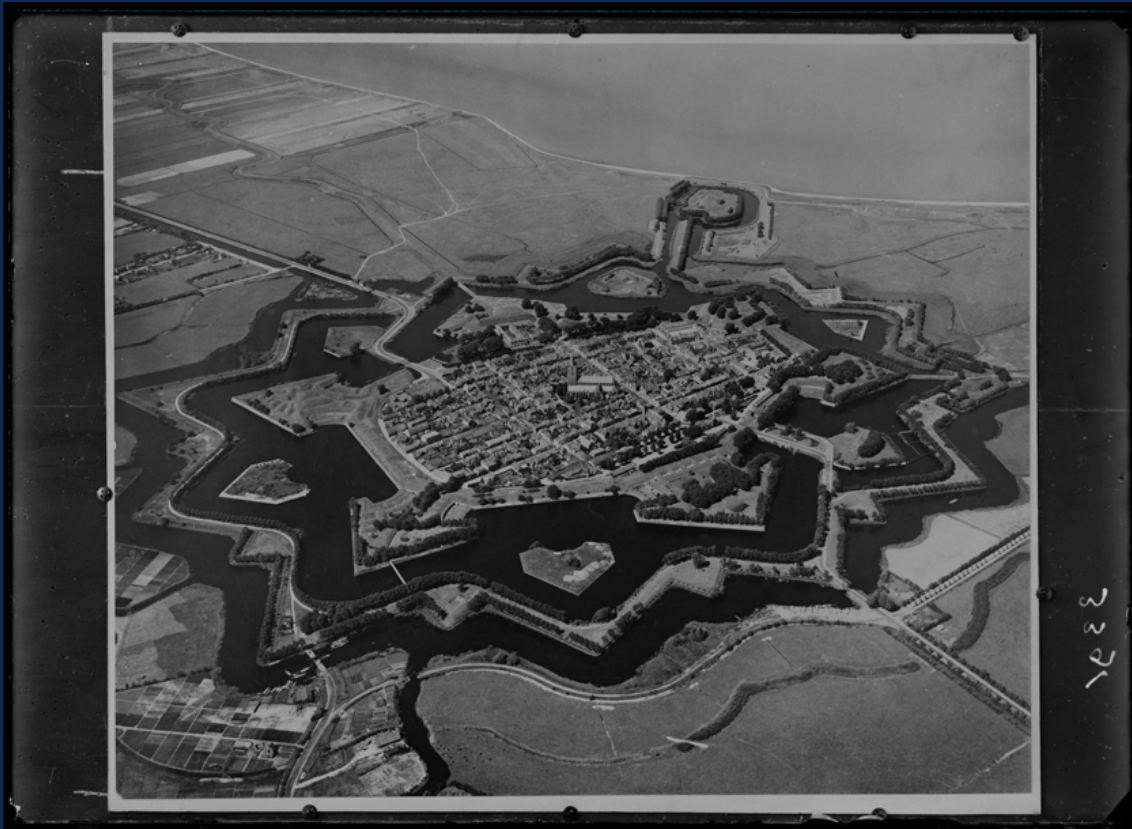
Afb. 1: Luchtfoto van Naarden rond 1925. De stad ligt nog geïsoleerd in vrijwel lege schootsvelden. De doorbraak richting Bussum, de Burgemeester van Wettumweg, is nog niet aangelegd. De burg over de buitengracht (de Kippenbrug) ligt er al wel.