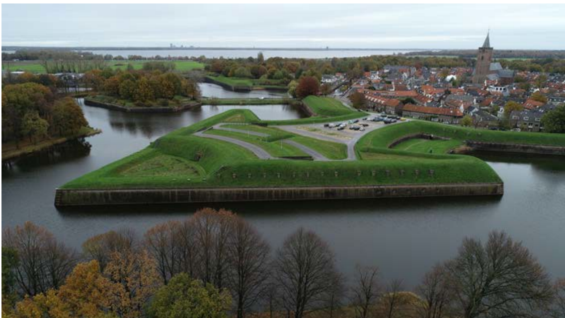
Afb. 2: Luchtfoto van bastion Nieuw Molen. Dit is een van de weinige plekken waar na 1926 militaire gebouwen zijn afgebroken. Het laboratoriumgebouw en het munitiemagazijn die hier rond 1878 werden aangelegd werden afgebroken in de jaren '50 van de 20e eeuw. Later werd er een parkeerterrein op het bastion aangelegd.

In een omschrijving licht dhr. Vos zijn plan verder toe. 7 Eerst schrijft hij in de derde persoon enkelvoud over zichzelf: