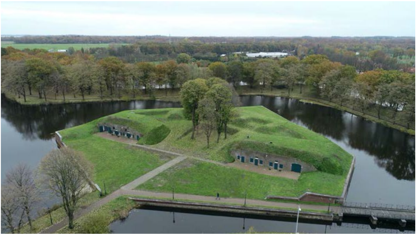
Afb. 6: Luchtfoto van ravelijn 6 waar in 2019 de gebouwen P' en Q' zijn getransformeerd tot een kantoor en een sportschool. Hier werd bezwaar tegen ingediend met enkele maanden vertraging in de bouw als gevolg. De plannen zijn uiteindelijk ongewijzigd uitgevoerd.