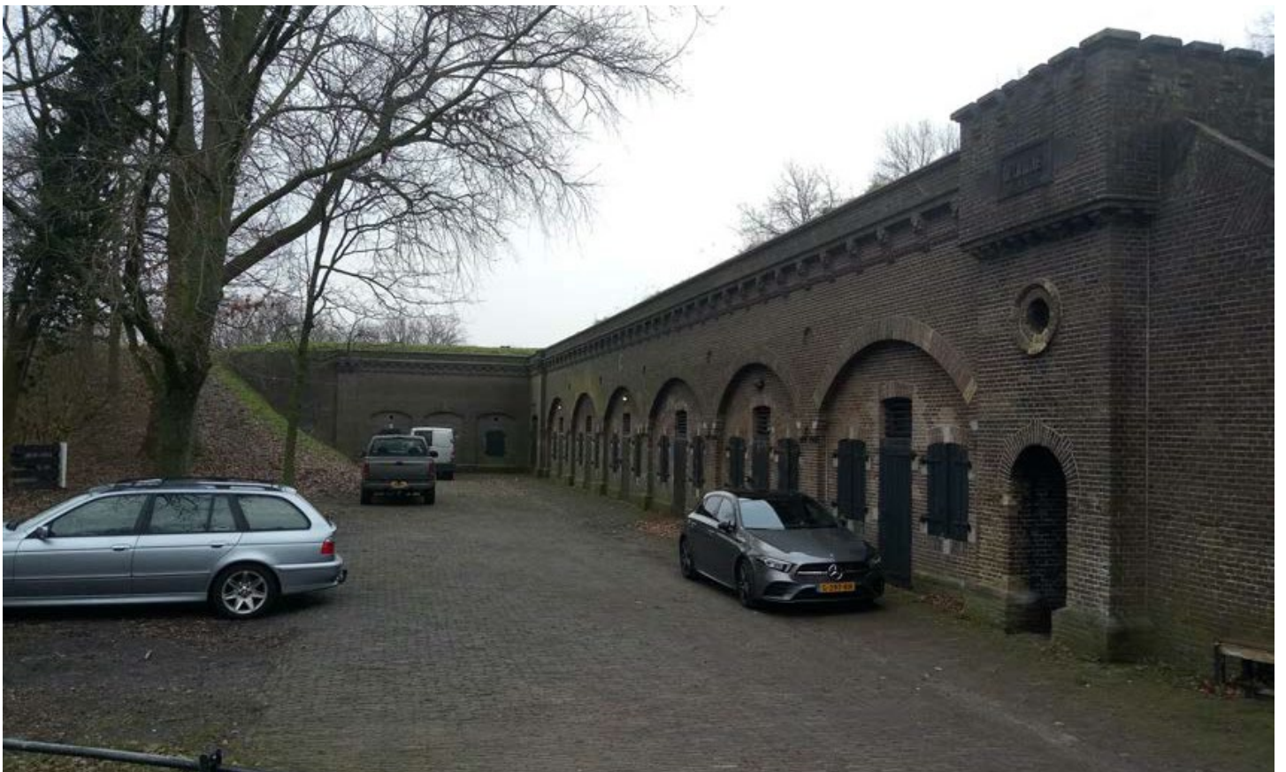
Afb. 7: Bewoners gebruiken de terreinen voor de kazernegebouwen als privé parkeerplaats. Een in de loop der jaren toegeëigd recht. Na de herbestemming van deze gebouwen kan dat niet meer. Wat wordt hier nu werkelijk door die herbestemming aangetast: de privé parkeerplaats of het erfgoed?