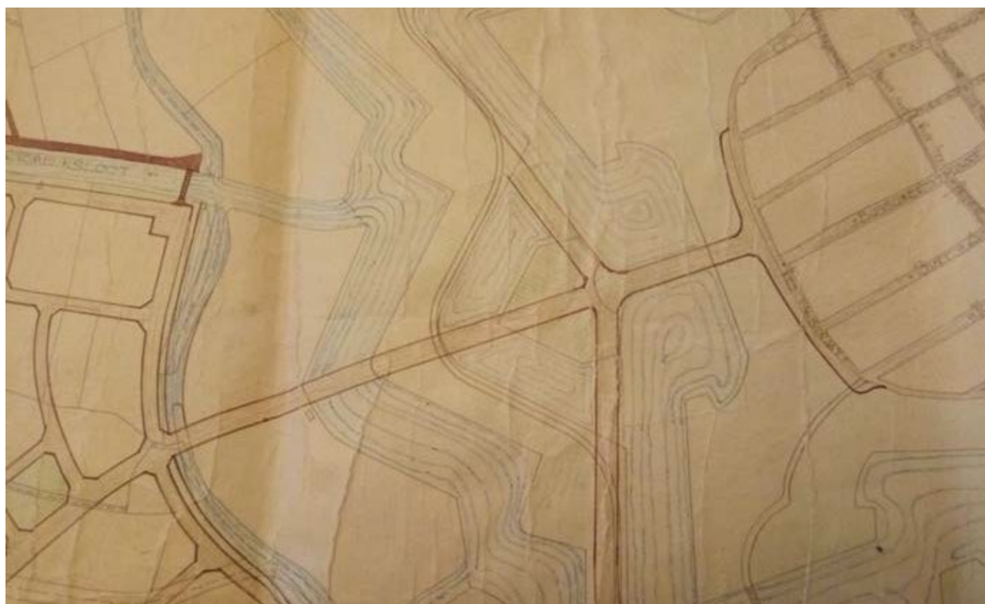
Afb. 4 en 5: Op de foto helemaal bovenaan de pagina: de Burgemeester van Wettumweg, die Naarden verbindt met Bussum en het station aldaar. Aan deze wegaanleg is de nodige discussie voorafgegaan. De plannen voorzagen in eerste instantie in een weg, die vanaf het midden van de vestingwal tussen de bastions Nieuw Molen en Turfpoort in een rechte lijn dwars over het ravelijn liep. Deze is te zien op de ontwerptekening hierboven. De Stichting Menno van Coehoorn maakte zich hard voor een, vanuit vestingbouwkundig oogpunt beter maar duurder, tracé via de keel van het ravelijn naar de bedekte weg. Uiteindelijk maakte de architect Dudok, zelf een oud genieofficier, een ontwerp dat voor iedereen acceptabel was. Dit werd uitgevoerd en in 1939 opgeleverd. (Luchtfoto beeldbank Gemeentearchief Gooise Meren en Huizen SSAN092N-maa028, ontwerptekening zelfde archief SSAN038, dienst gemeentewerken Naarden inv.nr. T281)